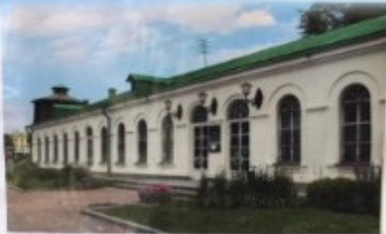
Музей природы Урала

Музей природы находится в Историческом центре Екатеринбурга и является объектом культурного наследия Свердловской области.