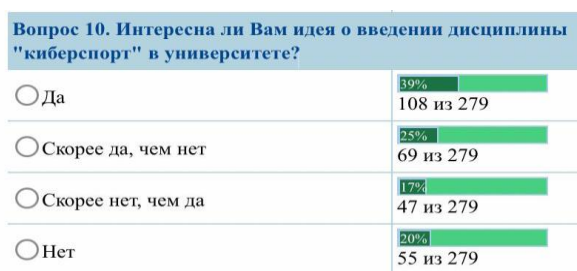
Рисунок 1 - Вопрос №10

Самым важным вопросом в нашем исследовании был вопрос о введении дисциплины «Компьютерный спорт» в университете.